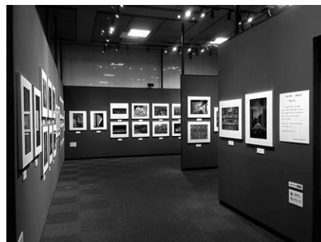
上・東京展 下・大阪展