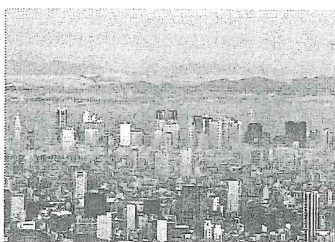
(港区赤坂、東京ミッドタ